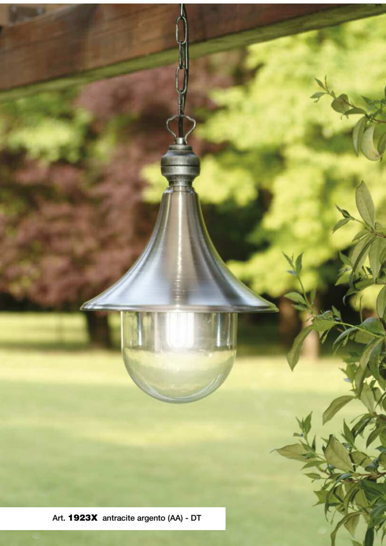
Art. 1923X antracite argento (AA) - DT