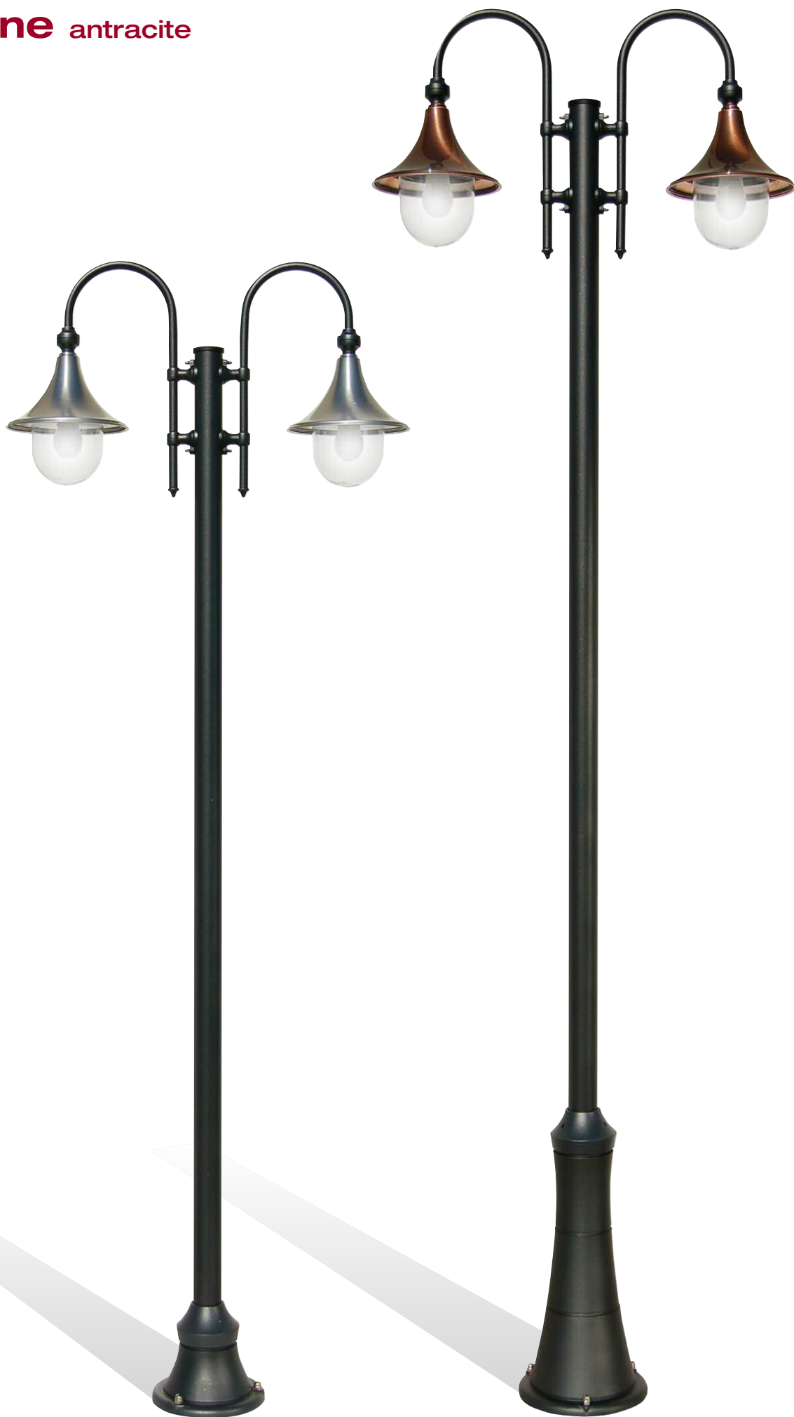
Art. 1926X/2L grigio antracite (AN) - DT - braccio B3 - palo P28 h 2330 mm - ø 820 mm