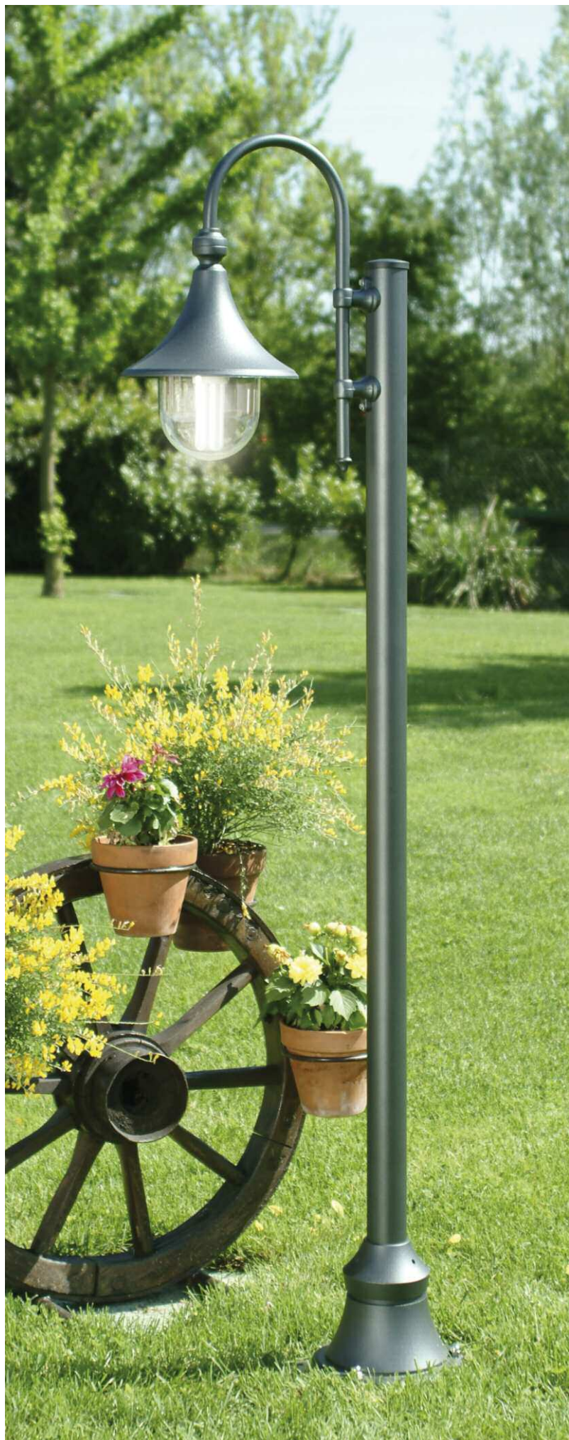
Art. 1925A/1L grigio antracite (AN) - DT