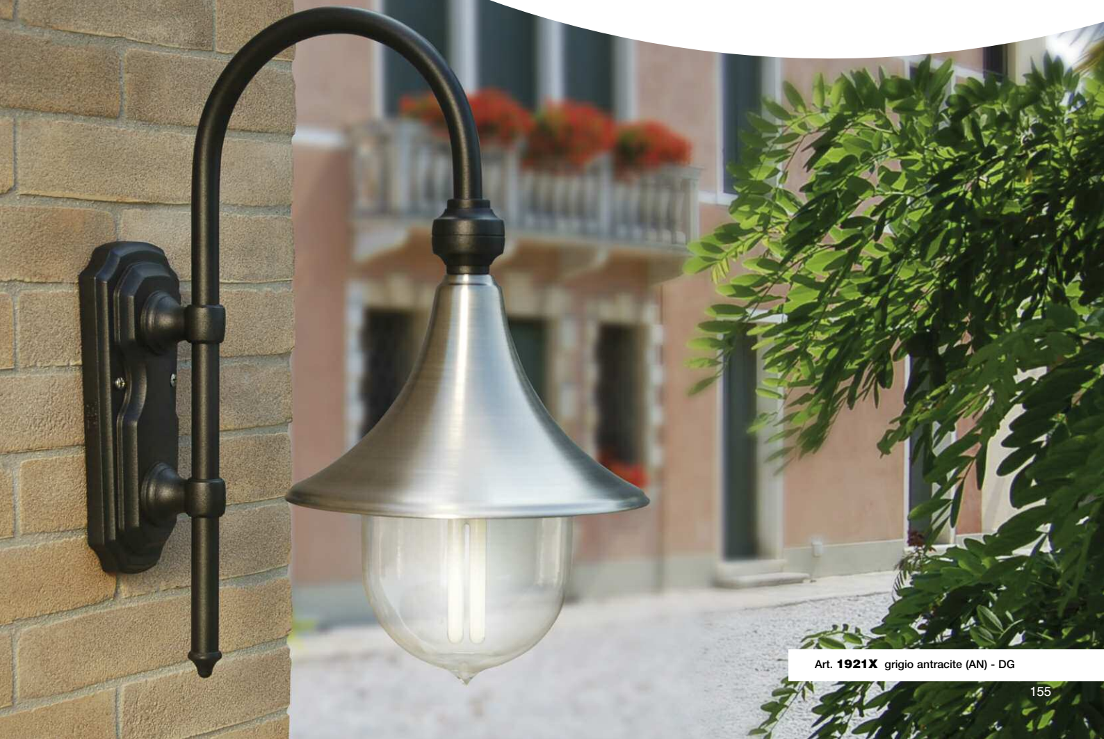
Art. 1921X grigio antracite (AN) - DG