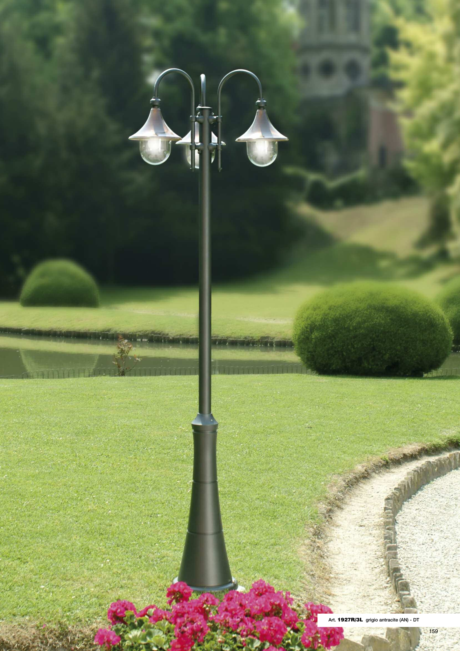
Art. 1927R/3L grigio antracite (AN) - DT