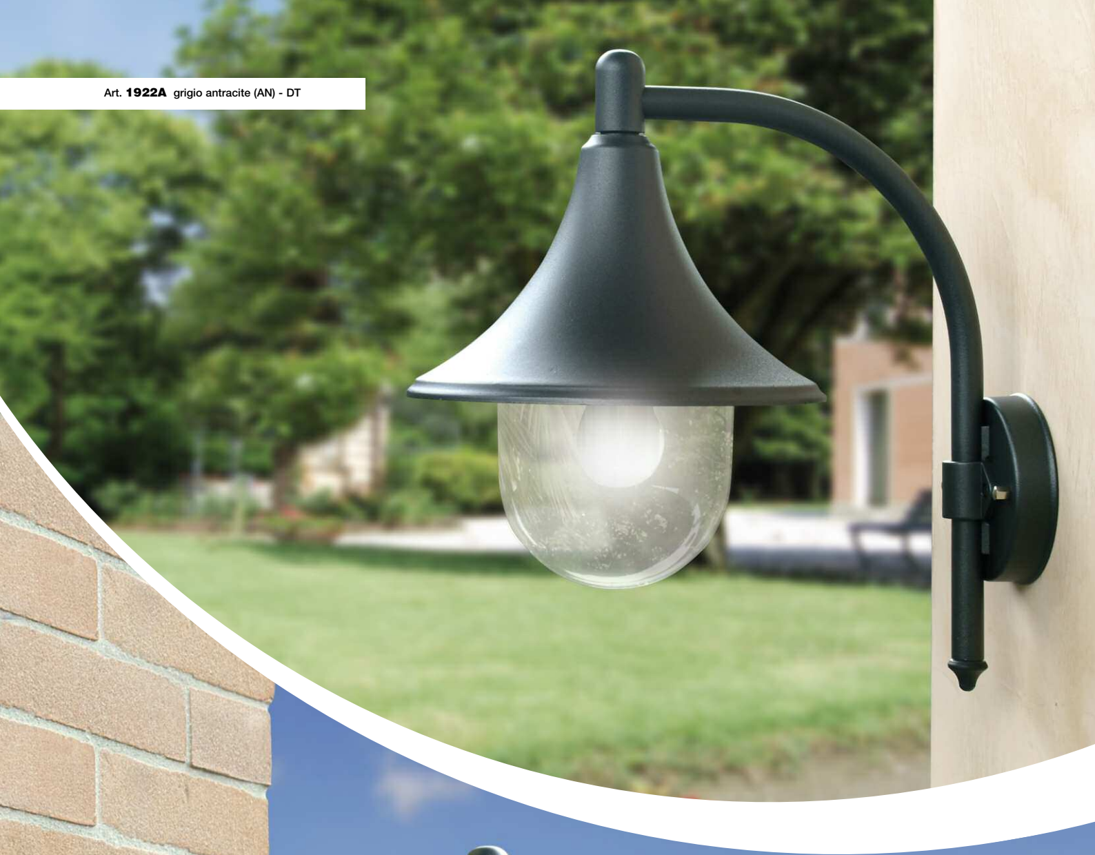
Art. 1922A grigio antracite (AN) - DT