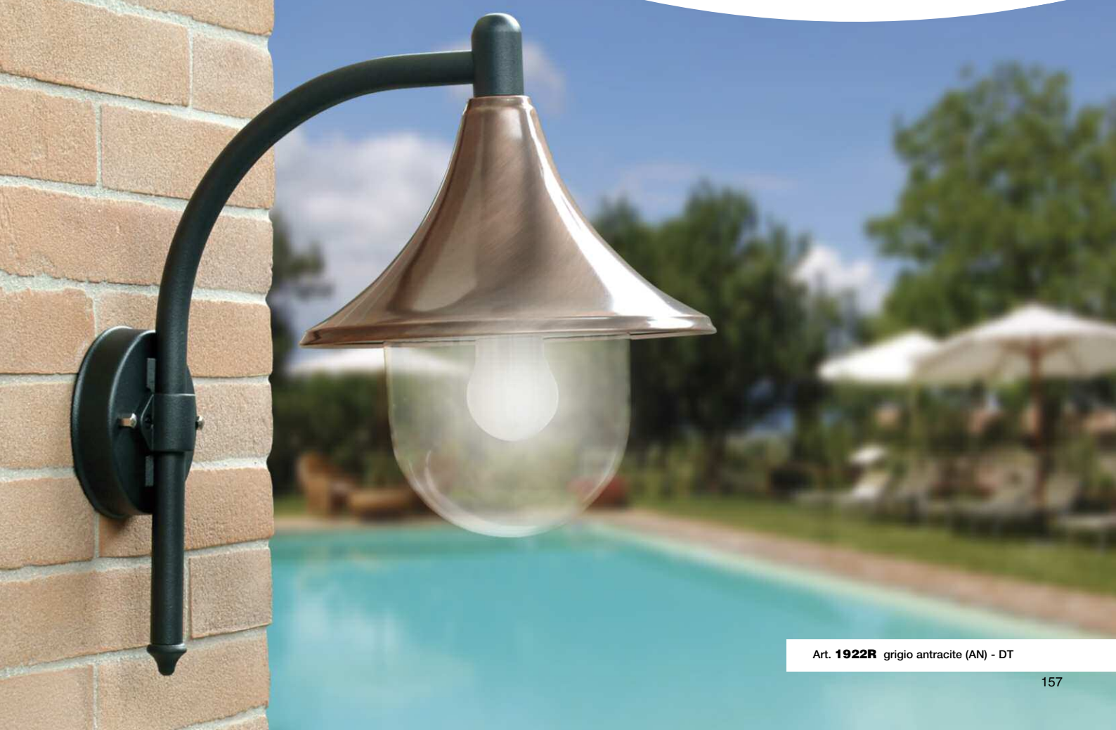
Art. 1922R grigio antracite (AN) - DT