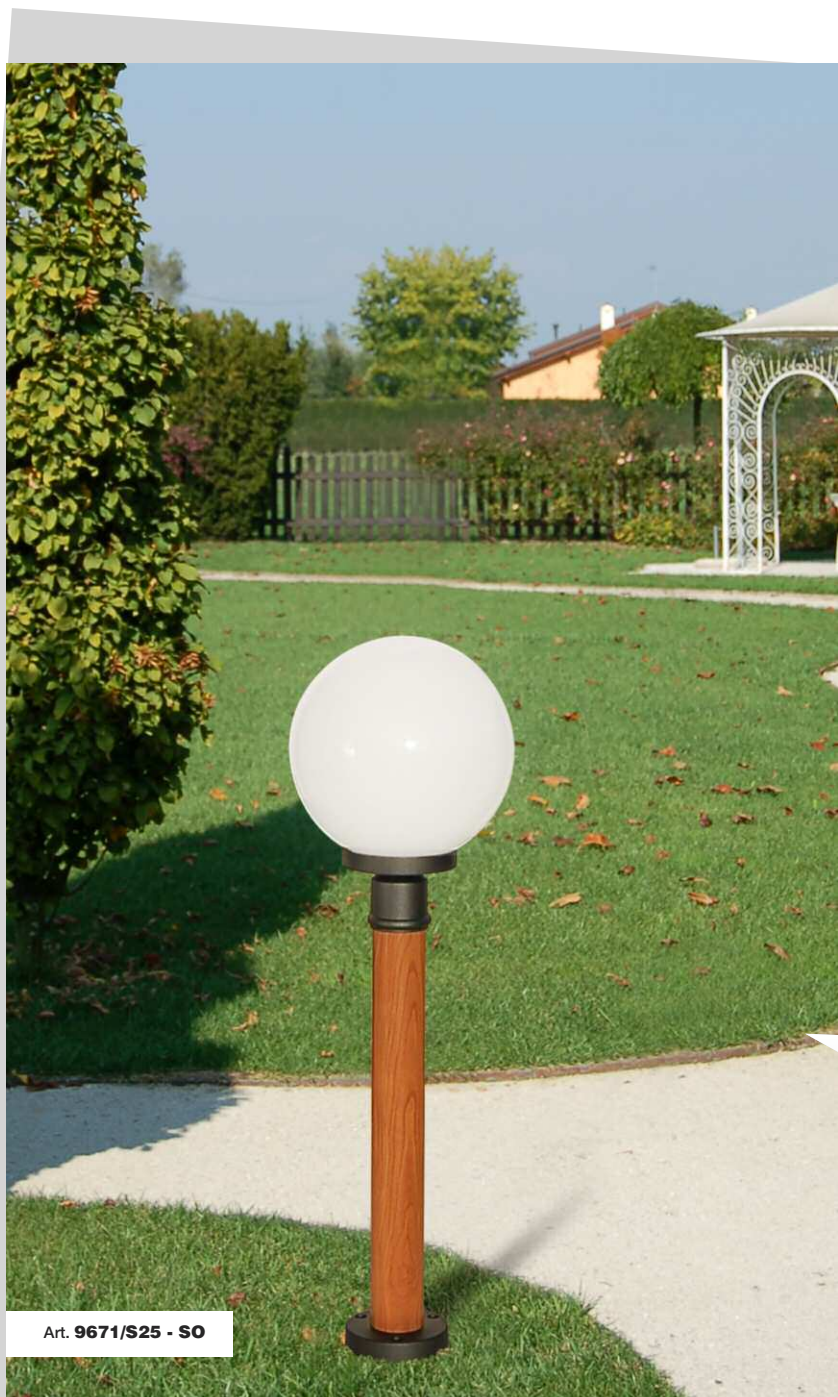
Art. 9671/S25 - SO