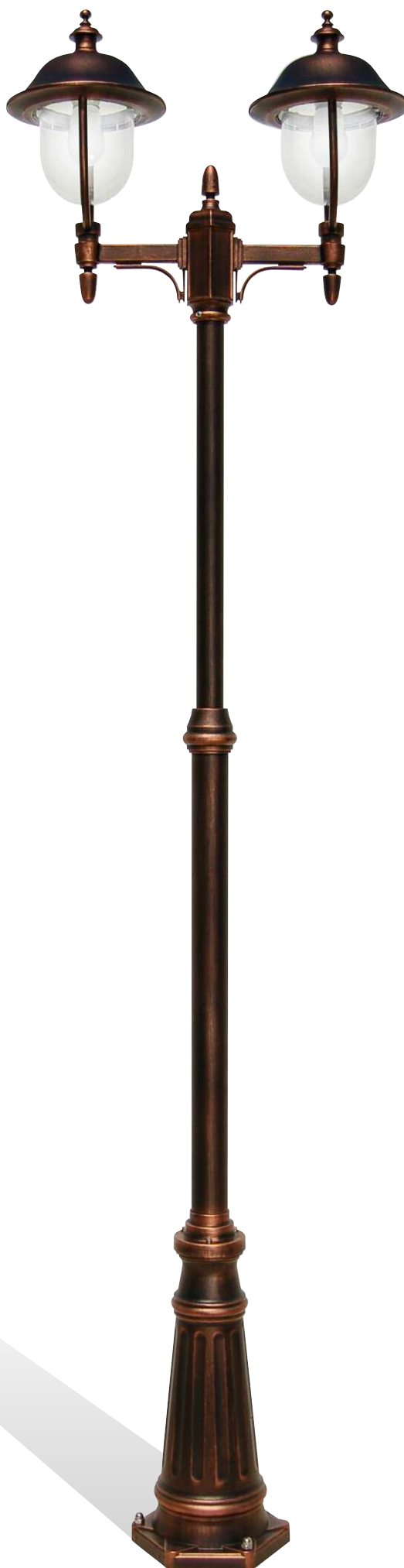
Art. 3017A/2L nero rame (NR) - DT - braccio B17 - palo P41 h min/max: 2030/2580 mm