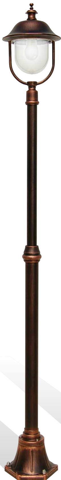
Art. 3016A/1L nero rame (NR) - DT - palo P40 h min/max: 1630/2180 mm