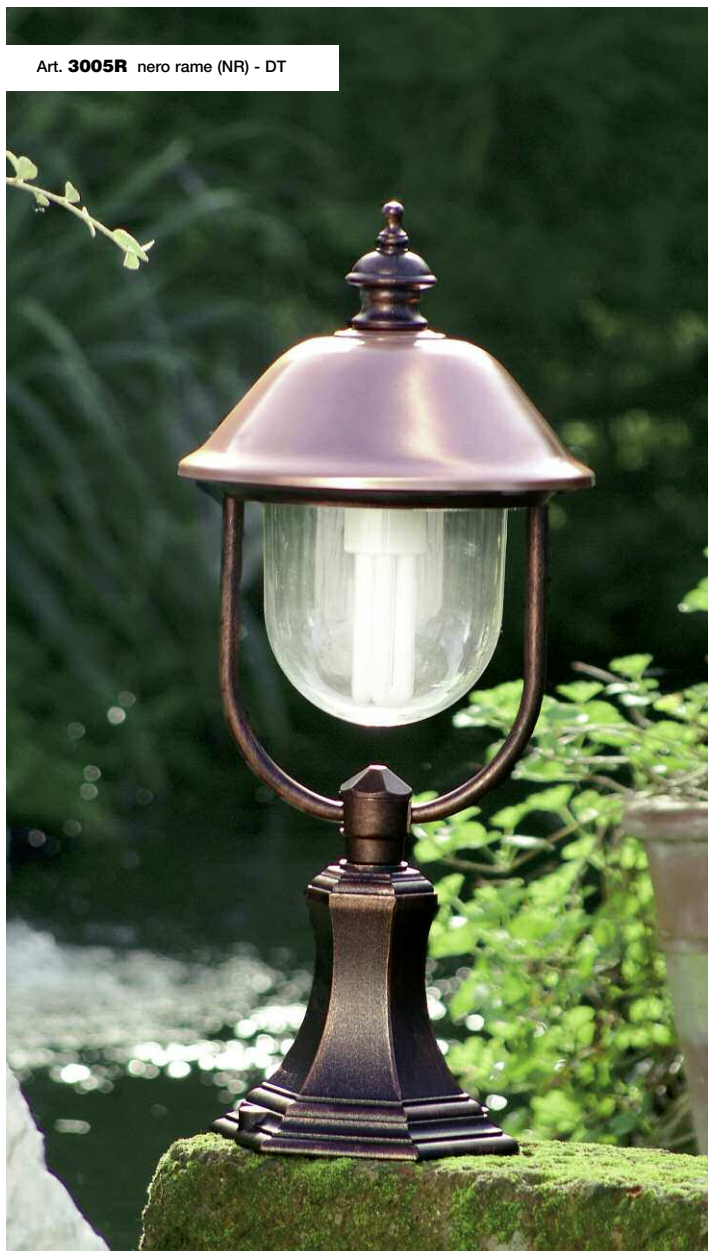
Art. 3005R nero rame (NR) - DT