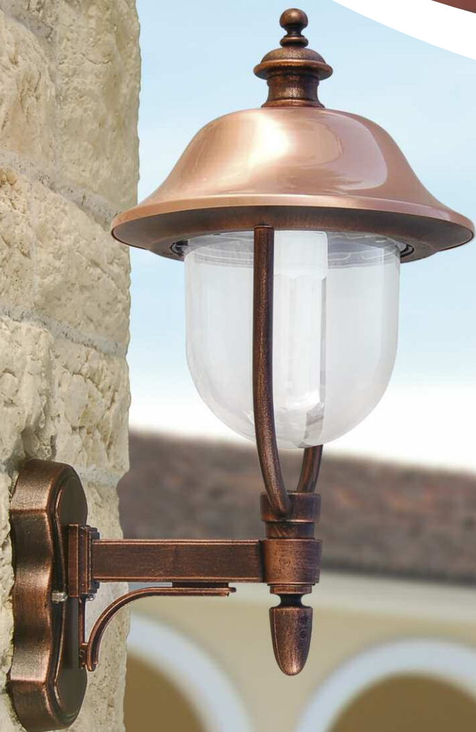
Art. 3001R-B17 nero rame (NR) - DT