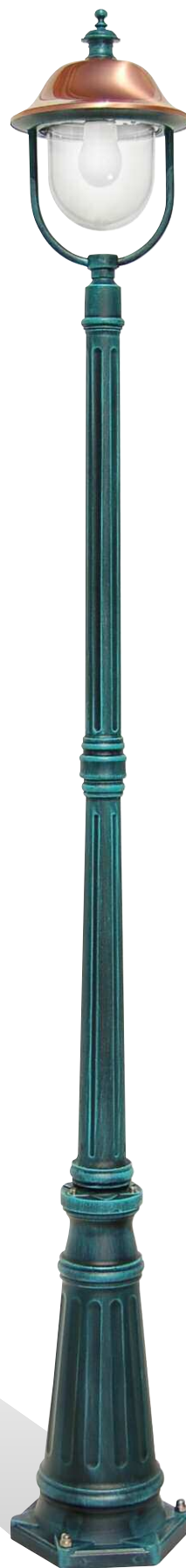
Art. 3010R/1L nero verde (NV) - DT - palo P05 h 2140 mm - ø 260 mm