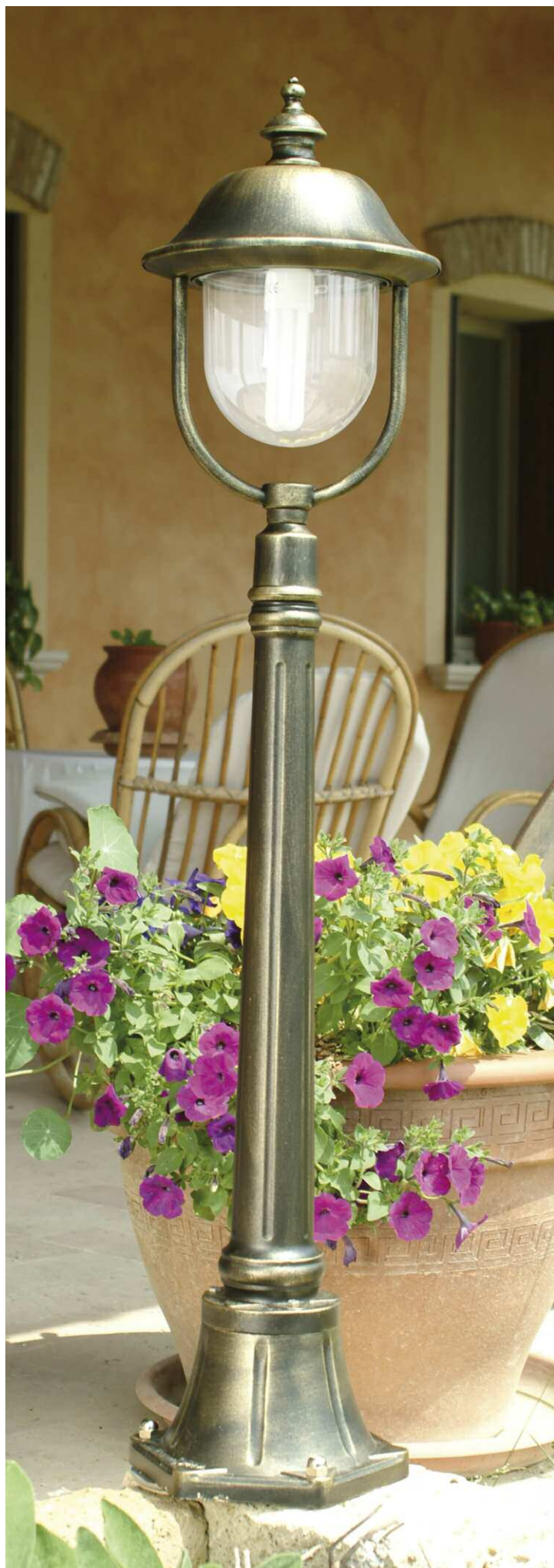
Art. 3008A/1L nero oro (NO) - DT