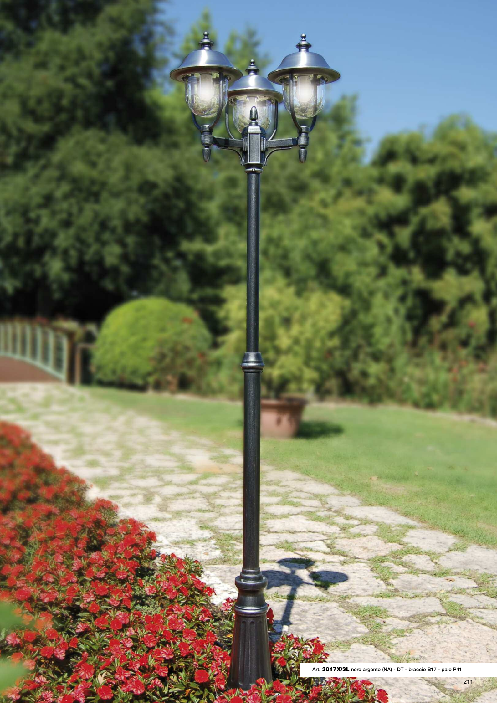
Art. 3017X/3L nero argento (NA) - DT - braccio B17 - palo P41