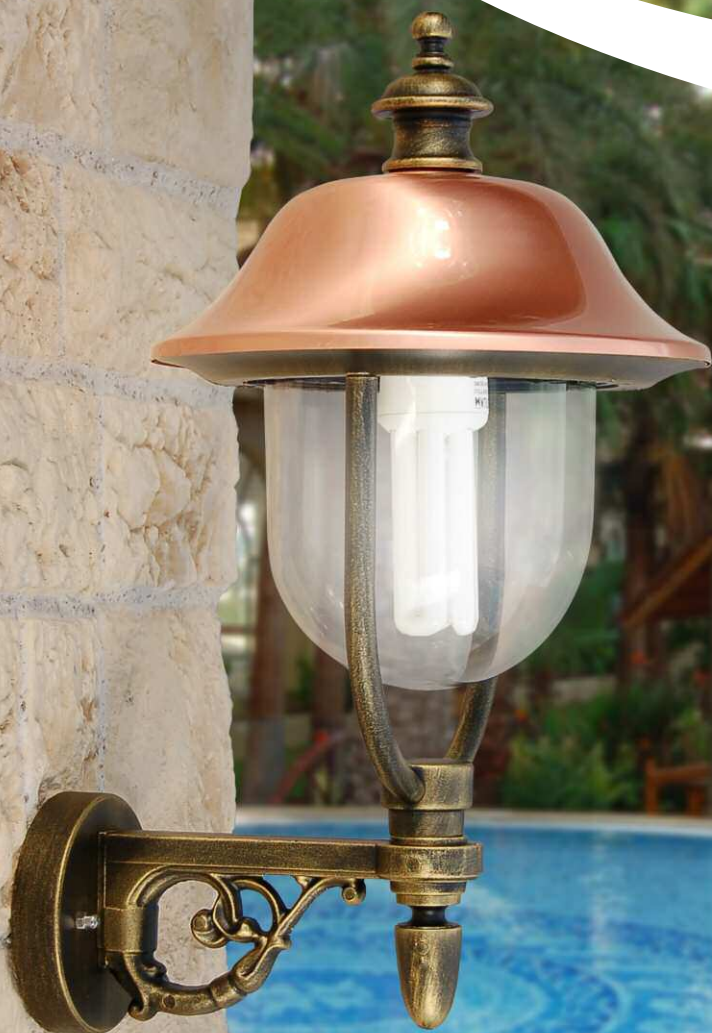
Art. 3001R-B19 nero oro (NO) - DT