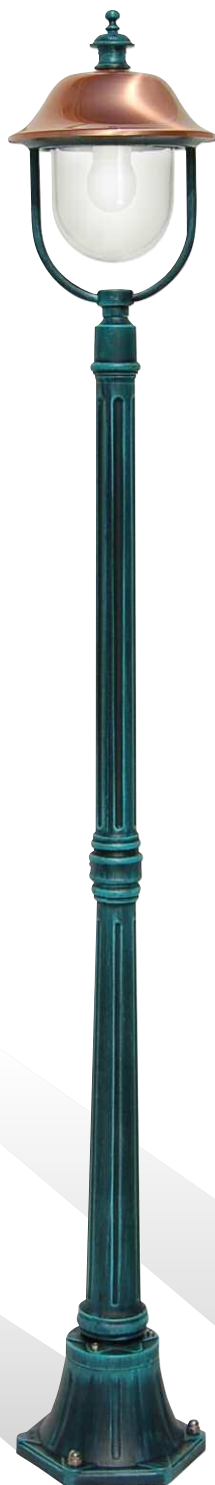
Art. 3009R/1L nero verde (NV) - DT - palo P04 h 1770 mm - ø 250 mm