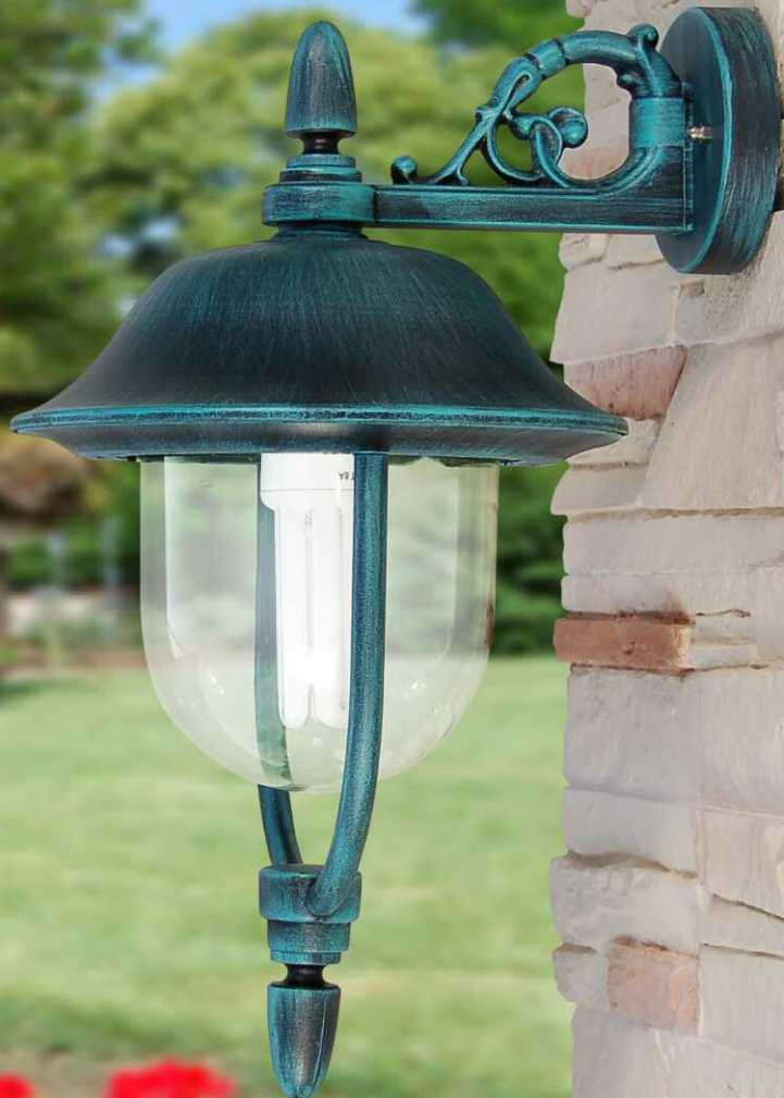
Art. 3002A-B19 nero verde (NV) - DT